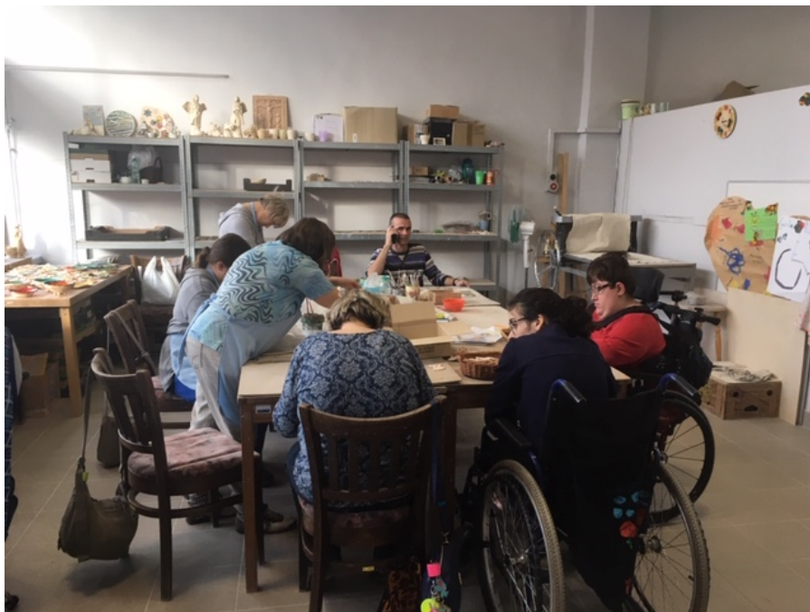
Produkcja ozdób ceramicznych w spółdzielni Klika

Podczas wizyty studyjnej mieliśmy okazję poznać całą historię miejsc, w których uczą się, przyjaźnią oraz pracują osoby niepełnosprawne. Studenci dowiedzieli się o możliwości współpracy w ramach wolontariatu i praktyk ze stowarzyszeniem i spółdzielnią. Obejrzeliliśmy warsztaty – miejsca, w których pracują ON, rozmawialiśmy z pracownikami. Jest to miejsce, w którym powstają piękne przedmioty z ceramiki, a ludzie mają poczucie sensu swej pracy. Zachęcamy do zakupu prezentów i sztuki użytkowej poprzez sklep internetowy spółdzielni: https://ceramika.centrumklika.pl