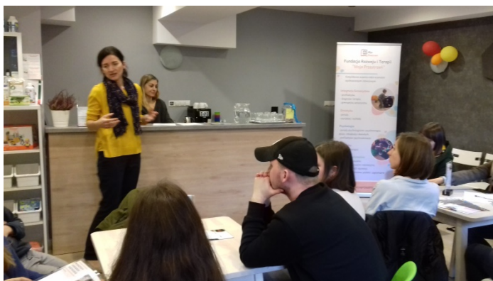
Wizyta w Fundacji Rozwoju i Terapii