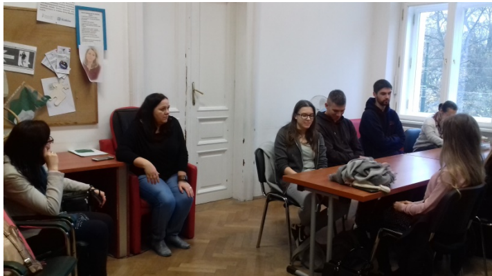
Wizyta w Stowarzyszeniu „Ognisko”

21 listopada wraz z grupą studentów Uniwersytetu Pedagogicznego im. KEN w Krakowie, a dokładniej Instytutu Prawa, Administracji i Ekonomii, uczestniczyliśmy w wizycie studyjnej w Chrześcijańskim Stowarzyszeniu Osób Niepełnosprawnych Ich Rodzin i Przyjaciół „Ognisko”. To niezwykle i szczególne miejsce. Prowadzi bowiem warsztat terapii zajęciowej, w którym w różnych pracowniach swoje umiejętności doskonaliły osoby niepełnosprawne intelektualnie. Prowadzi ono terapię, rehabilitację tych osób, ale także aktywizuje je społecznie i zawodowo. Stowarzyszenie założyło także spółdzielnię socjalną działającą pod tą samą nazwą. To ciekawy przykład przedsiębiorstwa społecznego, które wspiera osoby potrzebujące (dorosłych niepełnosprawnych, chorujących psychicznie i długotrwale bezrobotnych), dając im zatrudnienie w AWOKADO lunch bar w Krakowie. Warto dodać, że to Małopolski Lider Przedsiębiorczości Społecznej 2014 r. Studenci wysłuchali opowieści o historii powstania Stowarzyszenia, a w zwiedzaniu podmiotu towarzyszyli im także sami podopieczni, z wielkim zaangażowaniem opowiadając o swojej pracy, oprowadzając po pracowniach i odpowiadając na pytania.