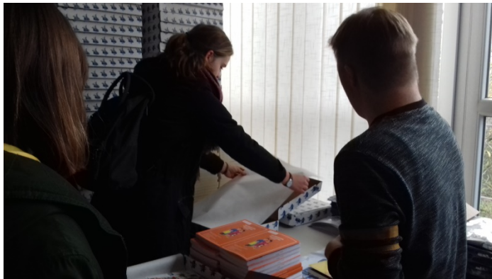
Wizyta w SPN APACZE