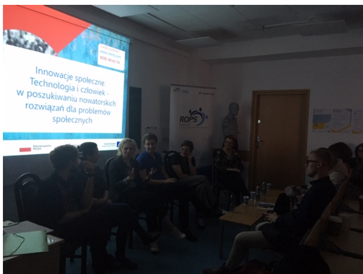
Uczestnicy panelu o Innowacjach

Można natomiast spuentować wypowiedzi panelistów, że tworzenie innowacji jest wspaniałym odczuciem – daje wiarę w swoją kreatywność, poczucie sprawstwa i wpływu na otoczenie. Uczestnicy dowiedzieli się też o nowej edycji projektu wspierającego innowacje – Inkubator Dostępności https://www.rops.krakow.pl/lewa/inkubator-dostepnosci