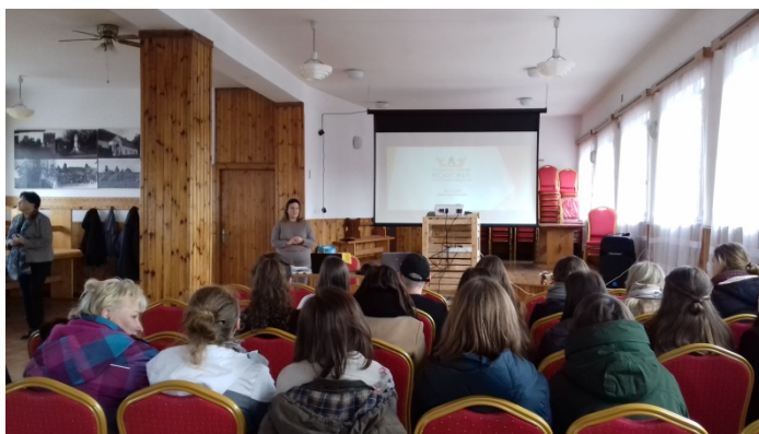
Wizyta w Stowarzyszeniu Korona