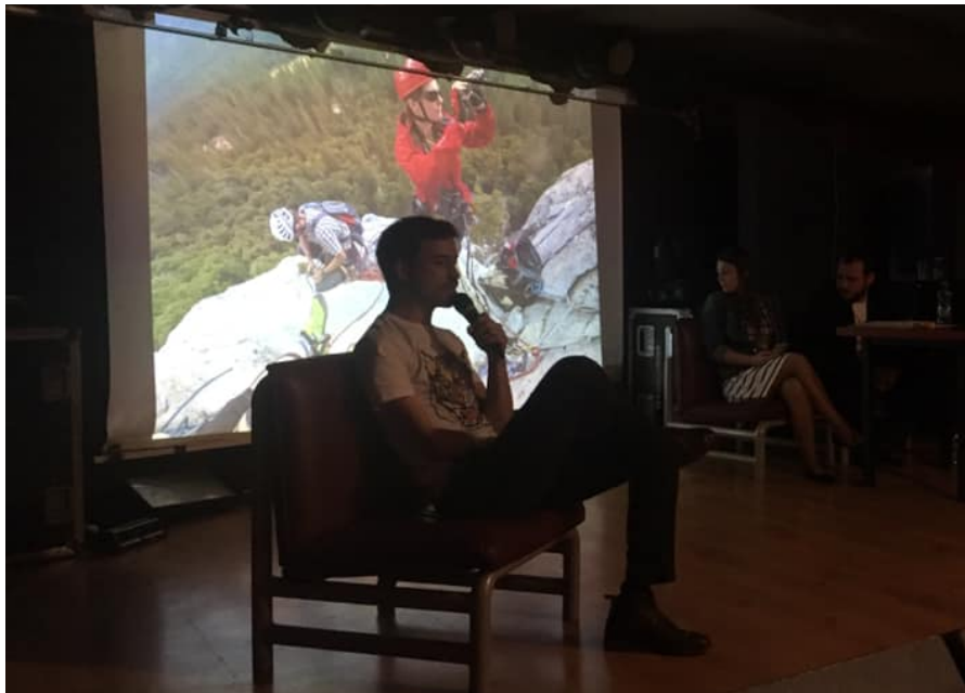
Wykład motywacyjny Jaśka Meli

Jubileuszowa edycja TES zobowiązuje, więc w tym roku nie obyło się bez dodatkowych atrakcji. Zaplanowano spotkanie z ciekawym i rozpoznawalnym człowiekiem, działającym w obszarze ekonomii społecznej. 25 listopada młodzi ludzie, studenci wielu krakowskich uczelni, nie tylko kierunków społecznych, licznie zgromadzili się w Klubie Studenckim „Żaczek” na spotkaniu z Jaśkiem Melą. Ten inspirujący człowiek, podróżnik i społecznik wygłosił wykład motywacyjny pt. „Czy pomaganie ma sens?, a następnie wziął udział w sesji pytań od studentów. Spotkanie moderowane było przez samych studentów, przedstawiceli Koła Naukowego Animatorów Społeczności Lokalnej UP, co pozwoliło im zdobyć cenne doświadczenie w prowadzeniu tego typu wydarzeń. Jasiek, osoba, która dużo w życiu doświadczyła podzieliła się ze studentami swoimi doświadczeniami, mobilizując do działania i pochylenia się nad drugim człowiekiem. Przekonywał, że trudno być pionierem, wariatem, który odważy się spróbować zrobić w życiu coś dobrego. Warto się angażować i być dla drugiego człowieka. Nie ma piękna bez trudności. Takimi słowami Jasiek Mela wręcz zaczarował publiczność, która słuchała go z wielkim skupieniem, chłonąc prawie każde zdanie. Po wykładzie przyszedł czas na zadawanie pytań, bezpośrednie kontakty i pamiątkowe zdjęcia.