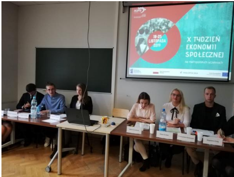
Drużyna Zwolenników (Propozycja) oraz Drużyna Przeciwników tezy (Opozycja)