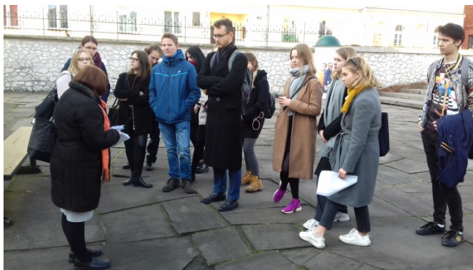
Spacer edukacyjny z grą miejską.

Wszyscy, którzy interesują się tematyką spółdzielczości i jednocześnie lubią zwiedzać Kraków mieli okazję uczestniczyć w spacerach edukacyjnych szlakiem organizacji społecznych i ruchu spółdzielczego w Krakowie. Spacery były prowadzone w dniach 18-21 listopada przez jedno z małopolskich przedsiębiorstw społecznych – Spółdzielnię Socjalną KAMPU, która specjalizuje się w organizowaniu wycieczek tematycznych po stolicy Małopolski i nie tylko. Studenci Akademii Górniczo-Hutniczej im. Stanisława Staszica w Krakowie, Uniwersytetu Pedagogicznego im. KEN w Krakowie oraz Uniwersytetu Jagiellońskiego odkrywali ślady organizacji pozarządowych, spółdzielni socjalnych, stowarzyszeń i fundacji, które miały lub mają swoją siedzibę na krakowskim Kazimierzu, przy okazji dowiadując się wiele na temat jego historii i kultury. Takie aktywne zajęcia są ciekawą formą przyswajania wiedzy, zwłaszcza, że nie polegają jedynie na zwiedzaniu i słuchaniu przewodnika-animatora, ale także na udziale w grze miejskiej. Studenci zostali wyposażeni w karty pracy, które musieli samodzielnie lub w grupie wypełnić, odpowiadając na umieszczone tam zagadki i pytania. Dzięki temu łatwiej przyswajali zdobyte informacje i Kazimierz nie ma przed nimi już tylu tajemnic.