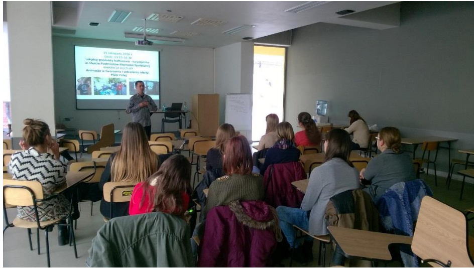
Luźna atmosfera na warsztatach