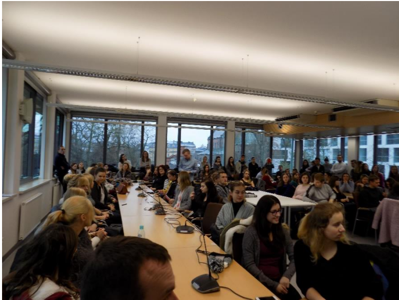
Publiczność debaty przybyła bardzo licznie