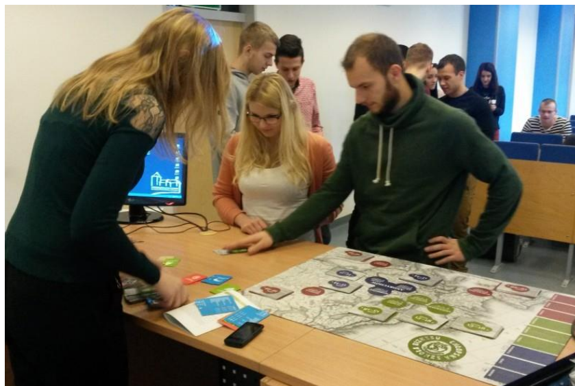
Produkcja i wyprawy handlowe

W trzech rozgrywkach w sumie wzięło udział 60 osób, które po zakończeniu gry poprosiliśmy o porównanie działalności gospodarczej z tą gospodarczo-społeczną (na bazie doświadczeń z gry). Studenci jednogłośnie przyznawali, że łączenie działalności gospodarczej (nastawienie na zysk) i działalności społecznej (uwzględnianie celów społecznych w bieżącej działalności) jest trudniejsze niż martwienie się jedynie o aspekt ekonomiczny działalności.