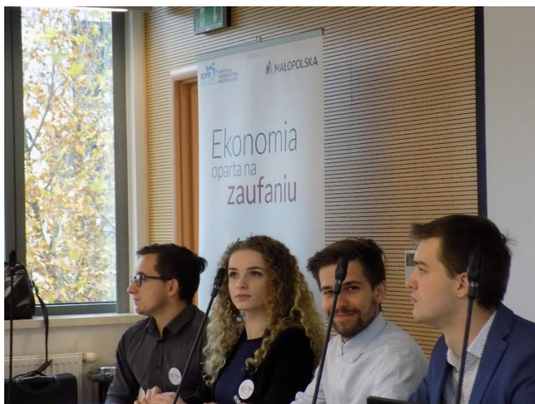
Drużyna Przeciwników tezy (Opozycja)

Na początku, wśród publiczności, zostało przeprowadzone badanie opinii publicznej dotyczące tezy debaty, iż podmioty ekonomii społecznej lepiej wpływają na rozwój Krakowa niż startupy . Wyniki przedstawiają się w następujący sposób: za tezą (propozycja) było 46 osób, przeciw tezie (opozycja) 57 osób.