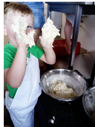
Spółdzielnia Socjalna "Smaki Gościńca"

„Damy Radę – współpraca i pomoc w czasach epidemii”